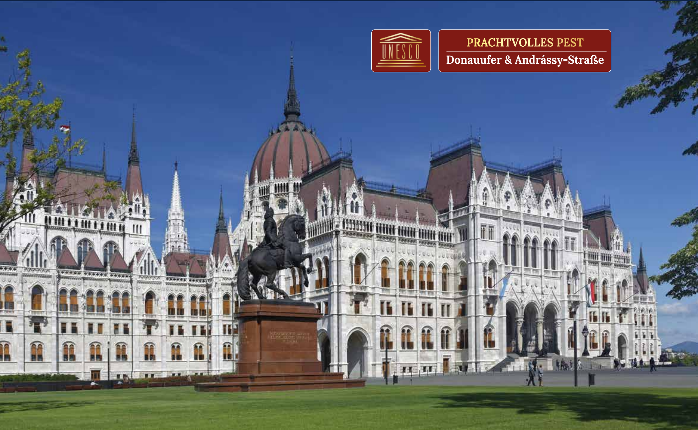
Majestätisches Parlamentsgebäude – Teil des UNESCO-Weltkulturerbes, das sich über große Teile der Stadt erstreckt

PRACHTVOLLES PEST Donauufer & Andrassy-Straße