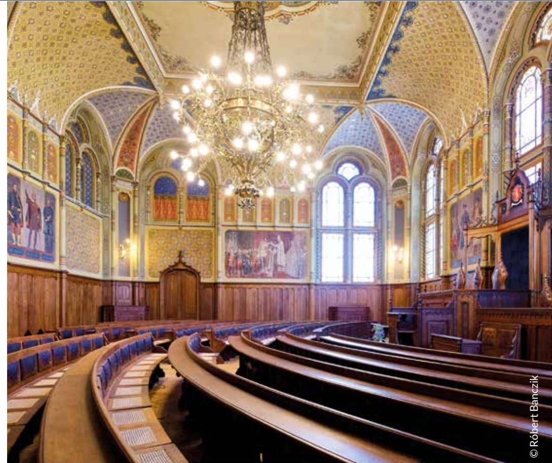
Im Festsaal des Rathauses erhalten wir einen Blick hinter die Fassaden

Ungarische Reitkultur hautnah Wir besuchen das traditionsreiche Gestüt „Tanyacsárda“ – eingebettet in die weite Flachebene Puszta südlich von Budapest. Die Pferdehirten, sogenannte „Csikós“, pflegen die Tradition der Lipizzaner-Zucht, die als immaterielles UNESCO-Weltkulturerbe anerkannt ist. Bei einer Kutschfahrt über das Gelände sehen wir regionale Arten wie Zackelschafe mit gedrehten Hörnern. In ihren blauen Trachten lassen die Csikós ihre langen Peitschen knallen und zeigen uns einzigartige Reitkunst.