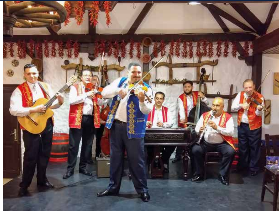
Volkstümliche Livemusik und mitreißende Melodien