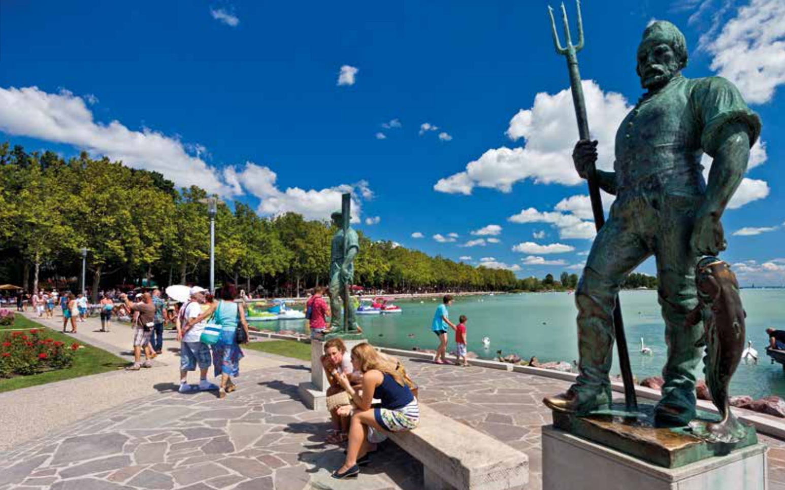
Wächter des Sees: charakterstarke Fischerstatuen an der Promenade von Balatonfüred