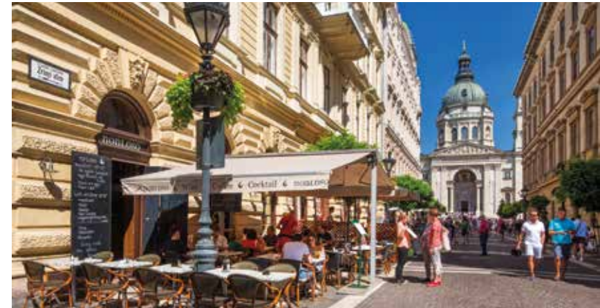
Zeit zum Schlendern auf den Boulevards von Pest