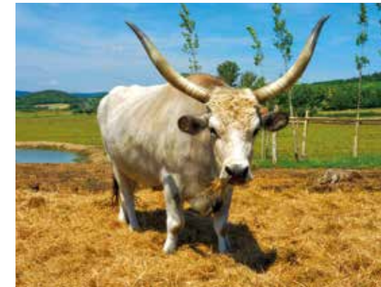
Kutschfahrt über das Gestüt und tierische Begegnungen wie mit dem Graurind