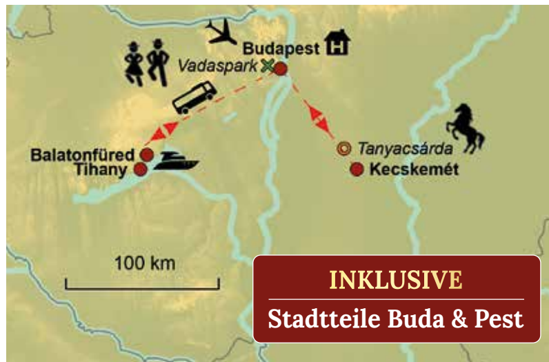
Unsere Ausflüge für Sie im Überblick