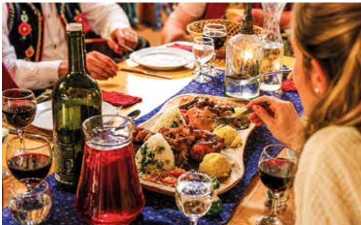
Regionale Kulinarik und traditionelle Tänze machen den Folkloreabend zu einem unvergesslichen Erlebnis