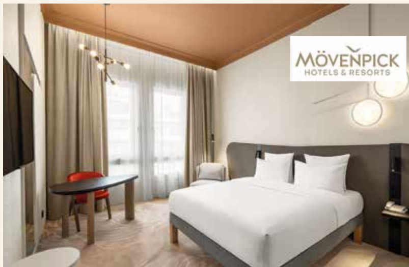
Komfortable und moderne Zimmer zum Entspannen

Stilvoller Auftakt in entspannter Atmosphäre mit kulinarischer Vielfalt und anregenden Gesprächen