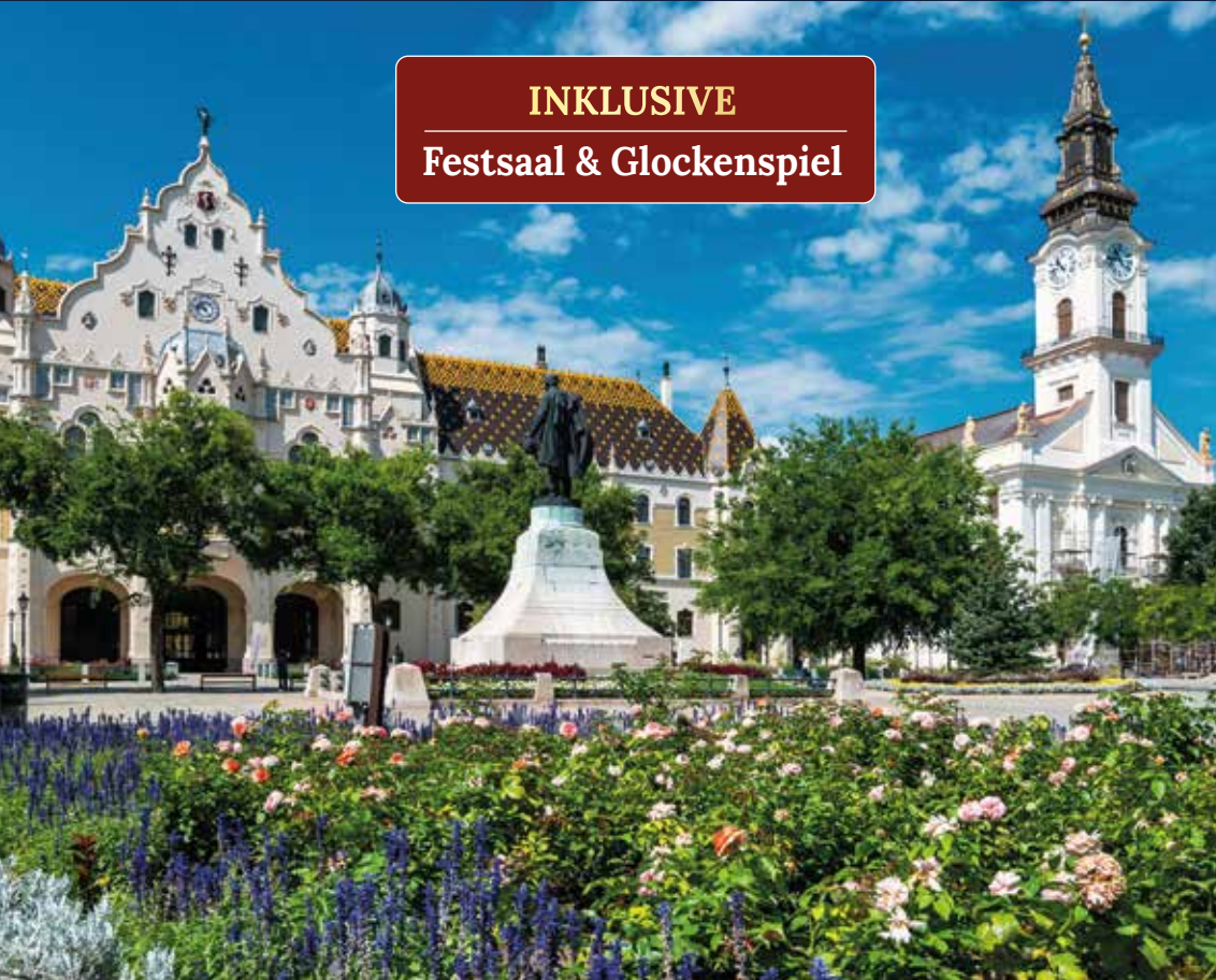
Verspielte Jugendstilarchitektur rund um das eindrucksvolle Rathaus

Rathauspracht & Melodienmedley Bei unserem Aufenthalt in Kecskemét, einer der schönsten Jugendstilstädte Ungarns, entdecken wir bei einem Spaziergang die farbenfrohe Architektur und das besondere Flair des Ortes. Reich verzierte Fassaden und Ornamente sowie liebevoll gestaltete Details machen die kleine Stadt sehenswert. Das Rathaus öffnet uns seinen Festsaal zur Besichtigung. Ein Glockenspiel mit bekannten ungarischen Volksmelodien rundet das Erlebnis stimmungsvoll ab.