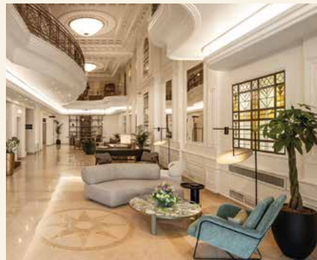
Art-nouveau-Charme in der Hotelloobby