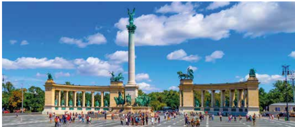
Heldenplatz – monumentales Ensemble zu Ehren der ungarischen Geschichte

Bei unserem Spaziergang durch Pest tauchen wir in das urbane Flair ein. Entlang prachtvoller Boulevards, geschichtsträchtiger Gebäude und belebter Plätze erfahren wir Interessantes über die Vergangenheit und Gegenwart der ungarischen Hauptstadt. Anschließend führt uns unser Weg in das sogenannte Stadtwäldchen. Zwischen alten Bäumen und eindrucksvollen Bauwerken wie der märchenhaften Burg Vajdahunyad entdecken wir auch die ruhigere Seite Budapests.