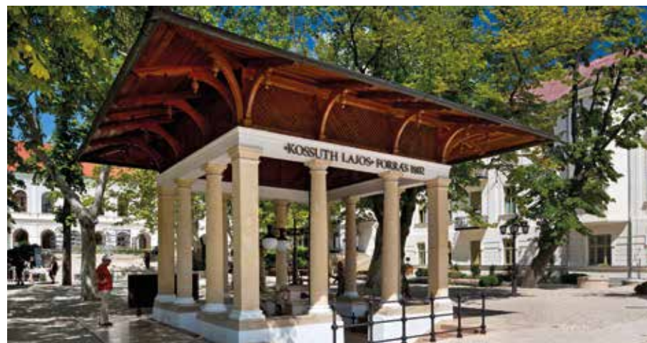
Mineralreiches Heilwasser direkt von der Quelle

Wir entdecken Tihany bei einem gemeinsamen Spaziergang. Vorbei an der markanten Benediktinerabtei und durch verwinkelte Gassen mit weiß getünchten Häusern, kunstvoll verzierten Fassaden und traditionellen Reetdächern entfaltet der historische Ort seinen unverwechselbaren Charme. Liebevoll gestaltete Läden und das mediterran anmutende Flair machen den besonderen Reiz der Halbinsel aus. Immer wieder eröffnen sich schöne Ausblicke auf den Balaton. Anschließend bleibt Zeit für einen entspannten Bummel durch die Geschäfte des pittoresken Ortszentrums.