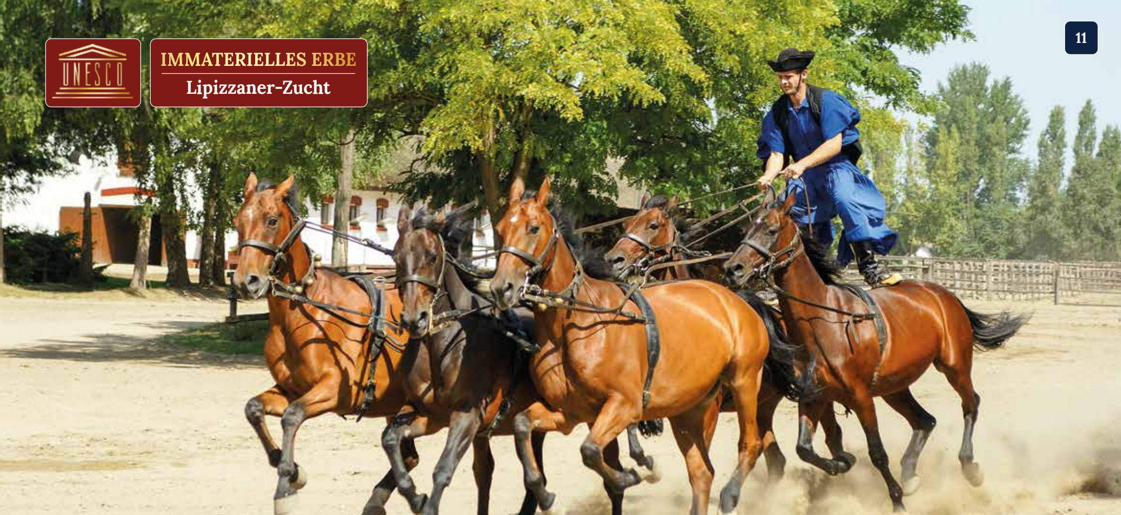
Die Hauptattraktion ist die „Ungarische Post“: Auf dem Pferderücken stehend, führt der Csikós ein Fünfer-Gespann