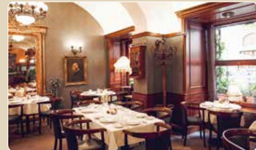
Denkmalgeschütztes Gebäude von 1812

Die imposante Burg Vajdahunyad vereint diverse Stilepochen in einem Ensemble