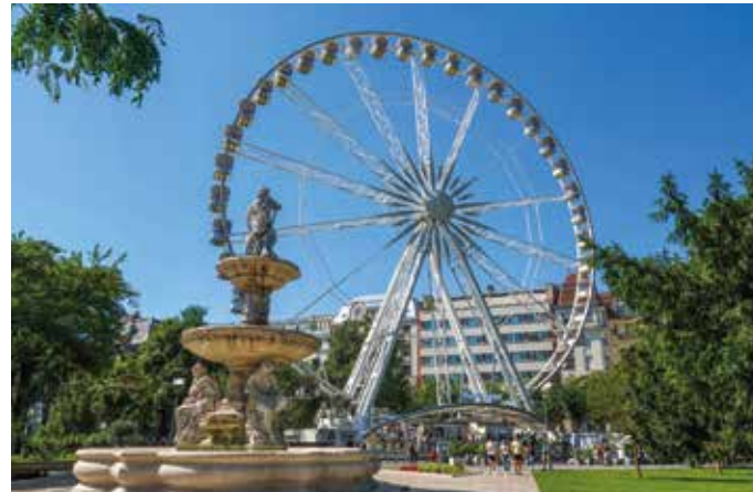
Das Riesenrad bietet beeindruckende Ausblicke

Entdecken Sie Budapest auf eigene Faust und genießen Sie die besondere Mischung aus königlicher Eleganz und entspanntem Großstadtflair. Ob ein Spaziergang durch die prachtvollen Boulevards der Altstadt, eine Kaffeepause am Flussufer, ein Besuch der Großen Markthalle oder eine Fahrt mit dem Riesenrad – bis zum Abend gehört der Tag ganz Ihnen. Unsere Reiseleitung gibt Ihnen gern Freizeittipps. Später erwartet uns zum Ausklang dieser facettenreichen Reise eine gesellige Donau-Schiffahrt mit Abschiedsdinner.