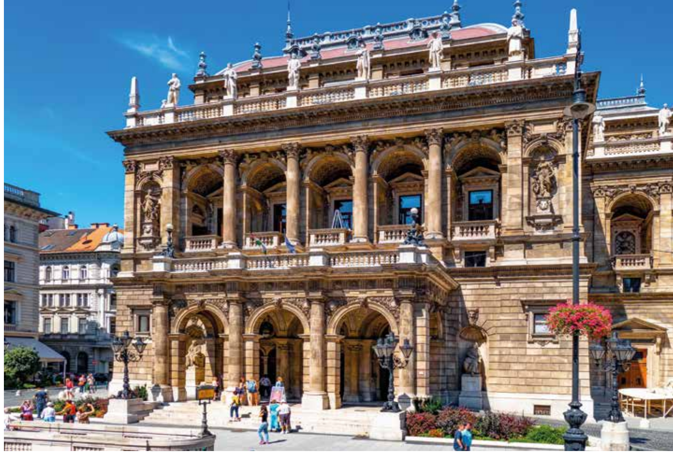
Beeindruckendes Opernhaus auf der UNESCO-geschützten Andrásy-Straße

Ob Reise, Event oder Service: Ihre Eindrücke helfen anderen Gästen – und uns in der Weiterentwicklung.