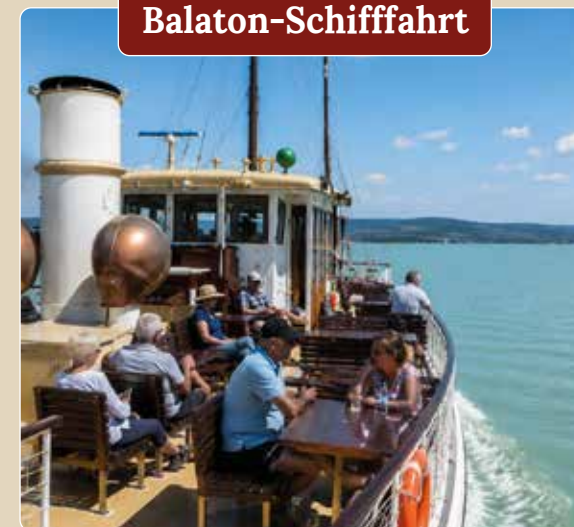
Wunderbare Aussicht vom Oberdeck aus