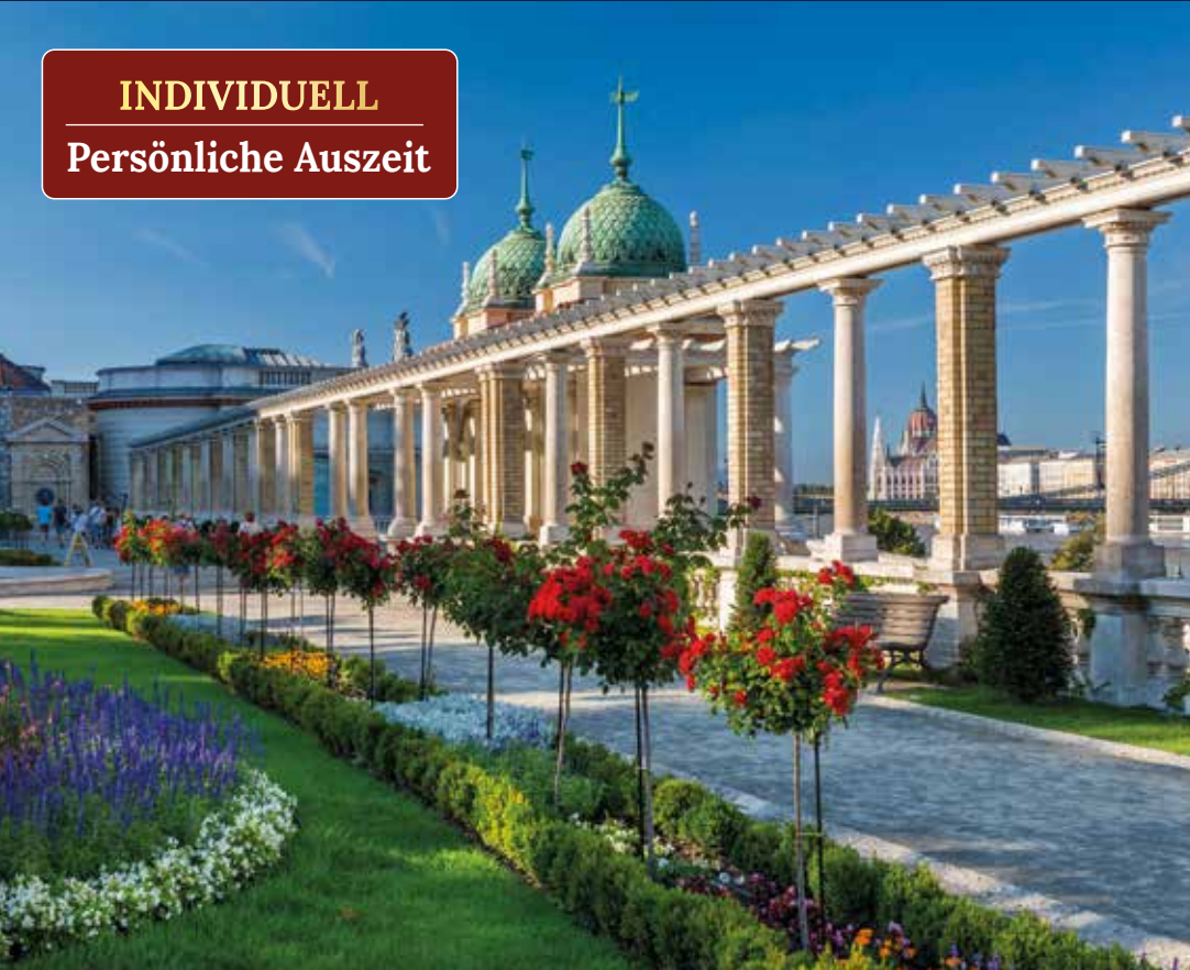
Flanieren entlang der Donaupromenade am Fuße des Burgbergs von Buda