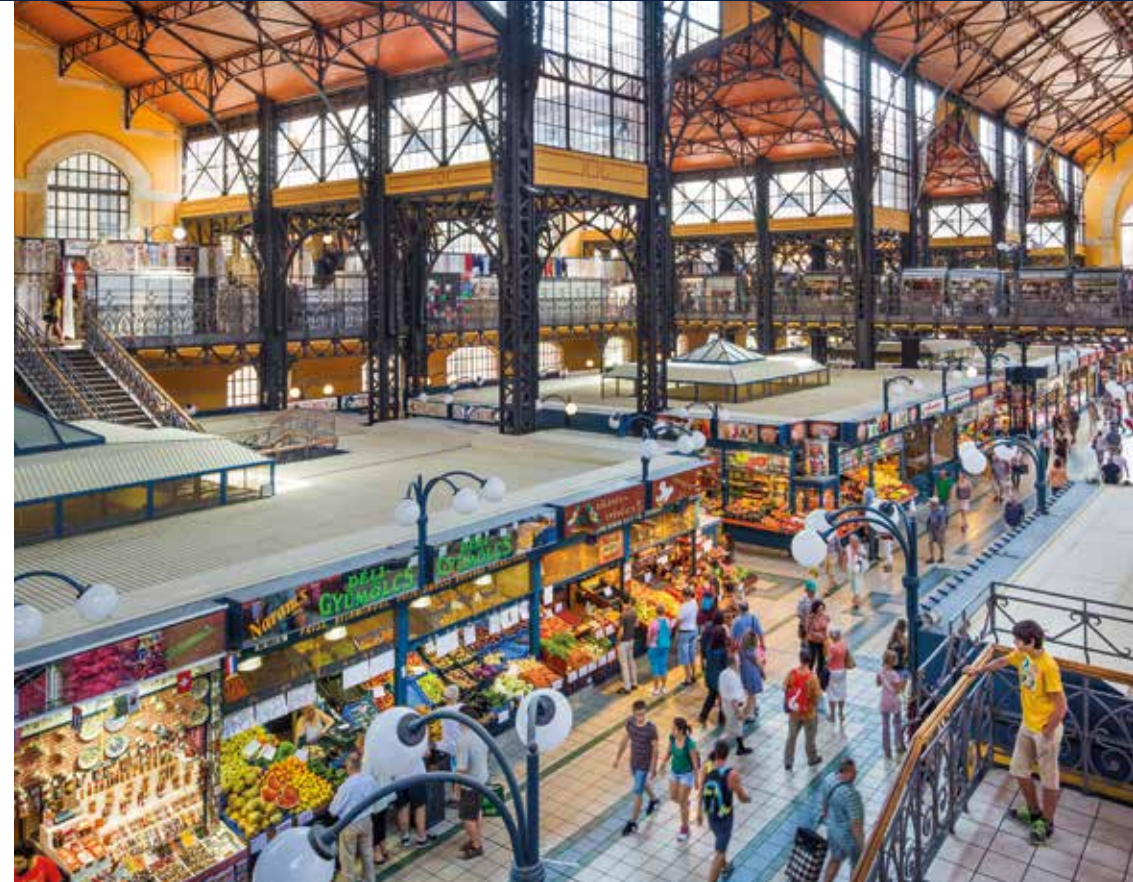
Die Große Markthalle begeistert mit regionalen Produkten und Souvenirs